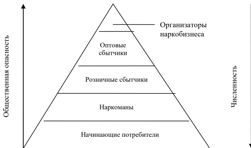
Рис. 2 Универсальная типология участников НОН

На рис. 2 в виде пирамиды представлена универсальная типология участников НОН. Она позволяет оценивать работу правоохранительных органов не по количественным, а по качественным показателям. Ее роль в анализе информации на стадии разработки антинаркотических территориальных программ трудно переоценить.